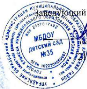
График проведения работ по специальной оценке условий труда